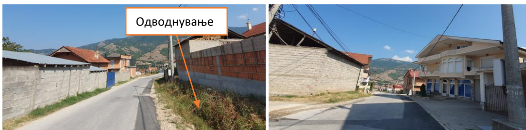
Слика 2 Сегашни услови на локалната улица СТ2 во населено место Пласница во Општина Пласница за време на теренската посета на 25.08.2023

Обезбедувањето на навремени информации за сите засегнати страни, вклучително и луѓето кои живеат вдолж улиците на проектот, луѓето кои ја посетуваат џамијата Пласница и луѓето кои го посетуваат игралиштето е од суштинско значење за организирање на нивните секојдневни активности. Изведувачот треба да ги земе предвид и да ги организира проектните активности на начин што кумулативните влијанија ќе се сведат на минимум и што е најважно да се изведуваат на безбеден и непрекинат начин.