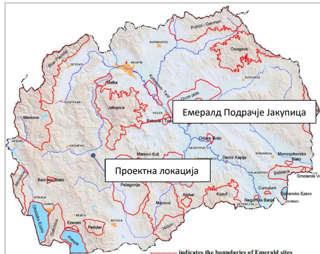
Слика 6 Мапа на заштитени подрачја во поширокото опкружување ба проектната улица во Општина Пласница