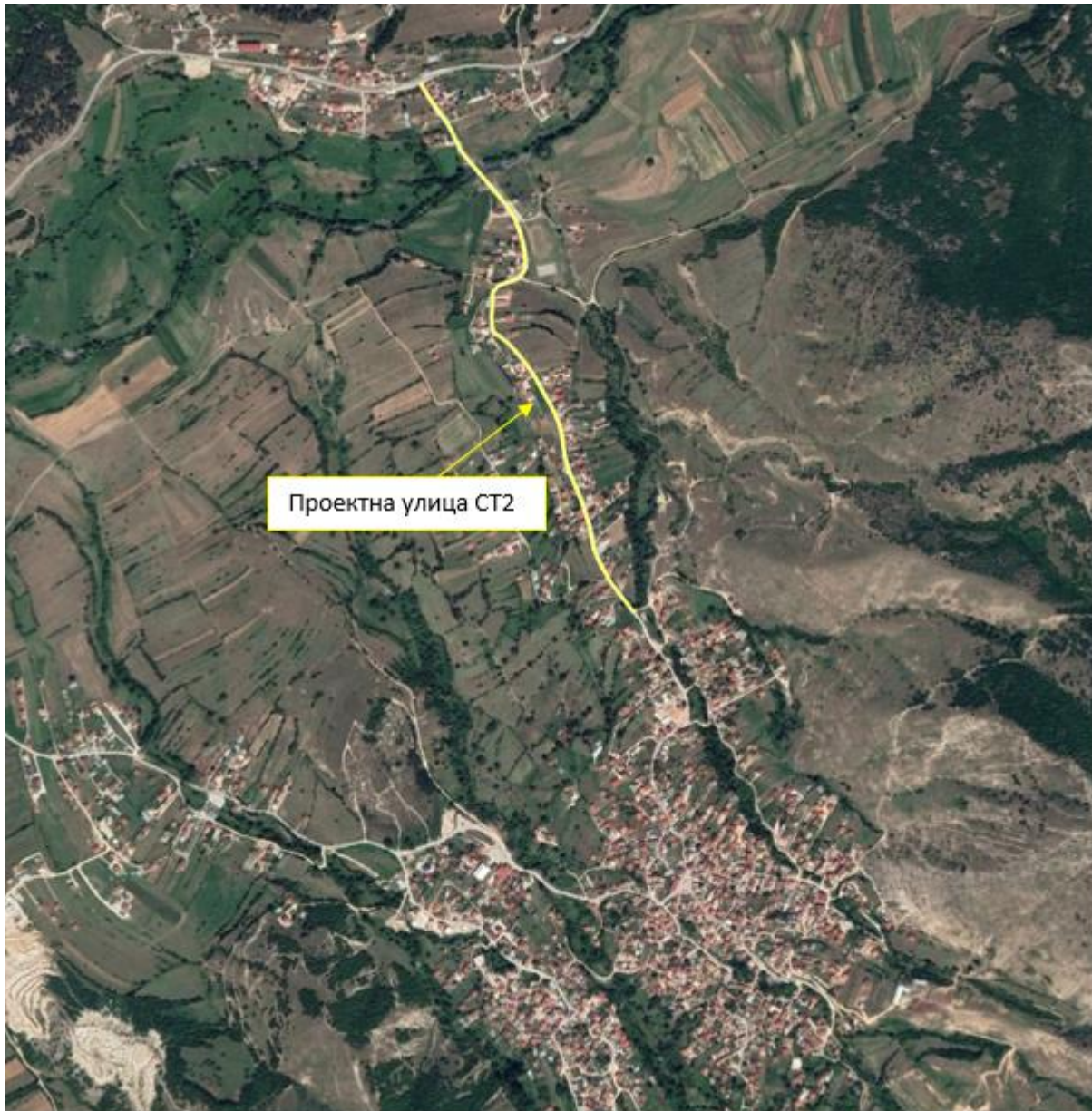
Слика 1 Локација на локалната улица СТ2 во населеното место Пласница во Општина Пласница

Согласно со Основниот проект предвидената реконструкција опфаќа 2 коловозни ленти и изградба на тротоар од едната страна на улицата и изградба на одводни канали како и поставување на соодветно осветлување вдолж улицата.