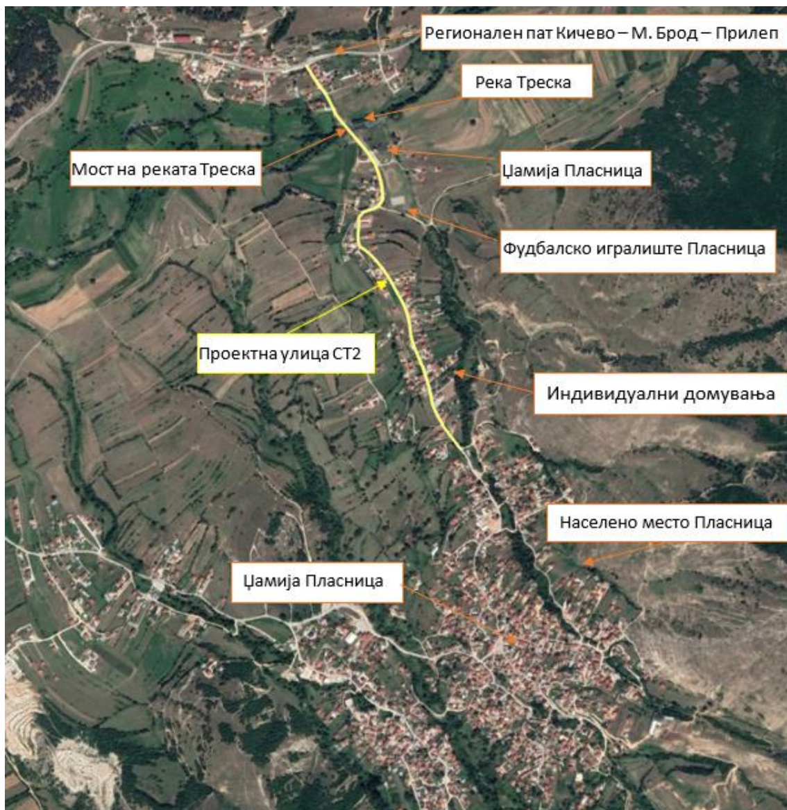
Слика 4 Локација на проектната улица во однос на чувствителните рецептори

(ревизија пред предавање на улиците во употреба). За спроведената Контрола на безбедноста на патиштата ќе биде изготвен формален Извештај во кој ќе бидат презентирани утврдените пропусти и недостатоци во безбедноста на патиштата како и препораките за нивно отстранување или намалување на нивното негативно влијание врз безбедноста на сообраќајот. Контрола на безбедноста на патиштата за овој инфраструктурен проект ќе се спроведе во фазата пред предавање на улиците во употреба.