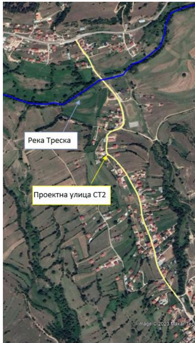
Слика 5 Локација на река Треска во релација со локалната улица СТ2 во населено место Пласница во Општина Пласница

Реката Треска ја вкрстува проектната локација поминувајќи под мост како што е прикажано на Слика 5.